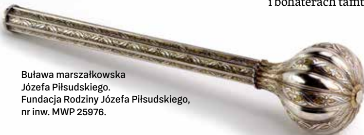
Buława marszałkowska Józefa Piłsudskiego. Fundacja Rodziny Józefa Piłsudskiego, nr inw. MWP 25976.

Czepek sanitariuszki, buława, samochód pancerny, fragment z gazety codziennej... Poprzez eksponaty z muzealnej wystawy uczniowie poznają historię wojny polsko-bolszewickiej: rolę wojska i Wodza Naczelnego oraz dowiedzą się, jak wyglądało wówczas codzienne życie i czy każdy walczył z bronią w ręku. Mówiąc o wydarzeniach sprzed 100 lat, które zdecydowały o historii Polski i Europy, postaramy się przywrócić pamięć o bohaterkach i bohaterach tamtych dni.