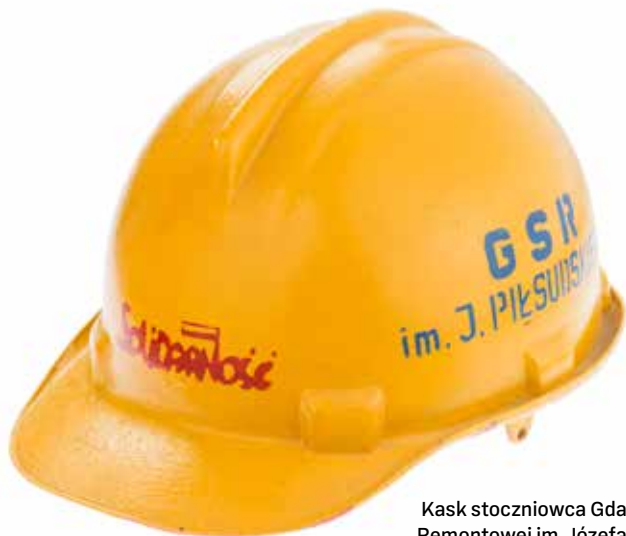
Kask stoczniewca Gdańskiej Stoczni Remontowej im. Józefa Piłsudskiego z l. 1981-1989, nr inw. MJP/Dep.FR.55

Druki zrewolucjonizowały świat, a słowo pisane od wieków wspierało każdą rewolucję i wielkie historyczne zmiany. Wiedział o tym Józef Piłsudski, który pod pseudonimem „Wiktor” wraz z innymi działaczami Polskiej Partii Socjalistycznej założył tajną drukarnię. „Bibuła” miała obudzić społeczeństwo do walki o zmianę warunków pracy i o niepodległość kraju. Niecałe sto lat później Polacy po strajkach robotników stworzyli antykomunistyczne organizacje i zaczęli zakładać kolejne konspiracyjne drukarnie. Uczestnicy zajęć dowiedzą się, co wspólnego miał Józef Piłsudski z podziemiem antykomunistycznym, a dzięki eksponatom na wystawie i materiałom źródłowym poznają historię tajnych drukarni na ziemiach polskich.