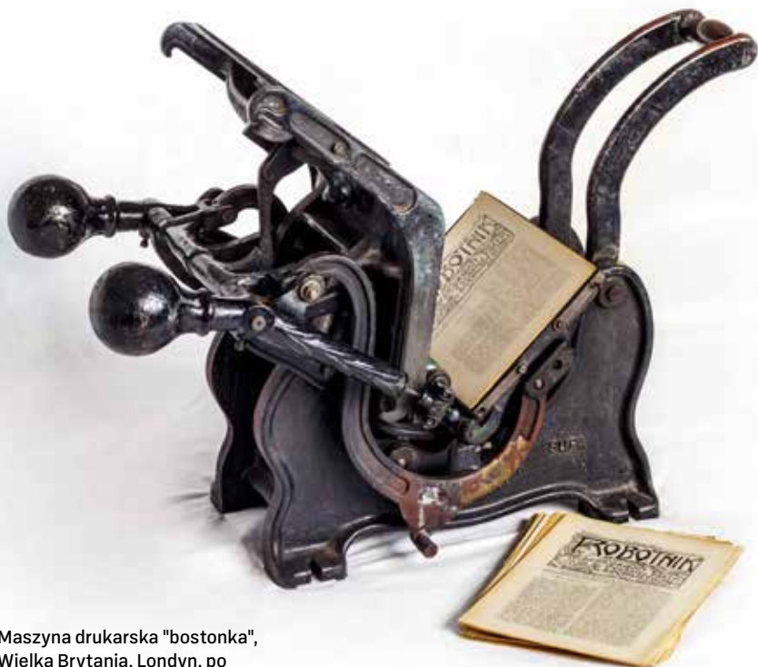
Maszyna drukarska "bostonka", Wielka Brytania, Londyn, po 1874 r., nr inw. MJP/6868

Podróż w zakamarki konspiracyjnej taktyki Józefa Piłsudskiego oraz jego towarzyszek i towarzyszy, dla których walka słowem – w tym drukowanie i powielanie „bibuły” – była ważną częścią boju o wolność Polski. Spotkanie z „bostonką” – maszyną drukarską, to nie tylko spotkanie z wyjątkowym obiektem. To jednocześnie podróż w zakamarki konspiracyjnej taktyki działaczy Polskiej Partii Socjalistycznej.