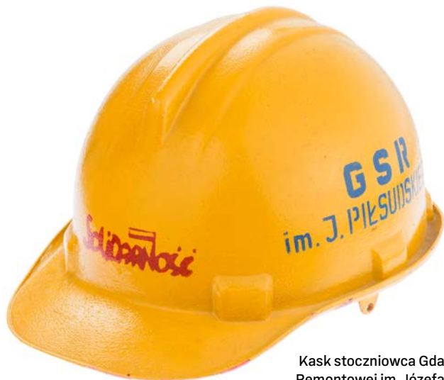
Kask stoczniewca Gdańskiej Stoczni Remontowej im. Józefa Piłsudskiego z l. 1981-1989, nr inw. MJP/Dep.FR.55

Druki zrewolucjonizowały świat, a słowo pisane od wieków wspierało każdą rewolucję i wielkie historyczne zmiany. Wiedział o tym Józef Piłsudski, który pod pseudonimem „Wiktor” wraz z innymi działaczami Polskiej Partii Socjalistycznej założył tajną drukarnię. „Bibuła” miała obudzić społeczeństwo do walki o zmianę warunków pracy i o niepodległość kraju. Niecałe sto lat później Polacy po strajkach robotników stworzyli antykomunistyczne organizacje i zaczęli zakładać kolejne konspiracyjne drukarnie. Uczestnicy zajęć dowiedzą się, co wspólnego miał Józef Piłsudski z podziemiem antykomunistycznym, a dzięki eksponatom na wystawie i materiałom źródłowym poznają historię tajnych drukarni na ziemiach polskich.