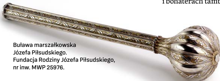
Buława marszałkowska Józefa Piłsudskiego. Fundacja Rodziny Józefa Piłsudskiego, nr inw. MWP 25976.

Czepek sanitariuszki, buława, samochód pancerny, fragment z gazety codziennej... Poprzez eksponaty z muzealnej wystawy uczniowie poznają historię wojny polsko-bolszewickiej: rolę wojska i Wodza Naczelnego oraz dowiedzą się, jak wyglądało wówczas codzienne życie i czy każdy walczył z bronią w ręku. Mówiąc o wydarzeniach sprzed 100 lat, które zdecydowały o historii Polski i Europy, postaramy się przywrócić pamięć o bohaterkach i bohaterach tamtych dni.