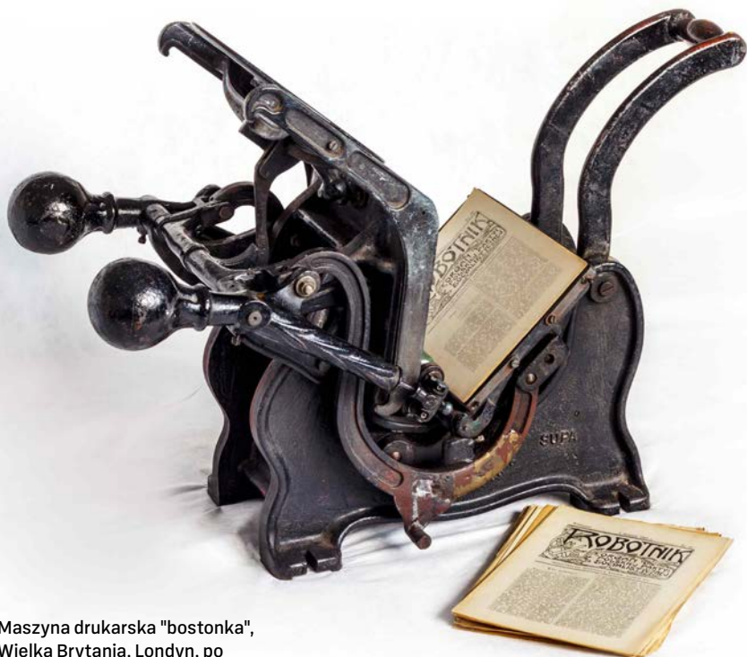
Maszyna drukarska "bostonka", Wielka Brytania, Londyn, po 1874 r., nr inw. MJP/6868

Podróż w zakamarki konspiracyjnej taktyki Józefa Piłsudskiego oraz jego towarzyszek i towarzyszy, dla których walka słowem – w tym drukowanie i powielanie „bibuły” – była ważną częścią boju o wolność Polski. Spotkanie z „bostonką” – maszyną drukarską, to nie tylko spotkanie z wyjątkowym obiektem. To jednocześnie podróż w zakamarki konspiracyjnej taktyki działaczy Polskiej Partii Socjalistycznej.