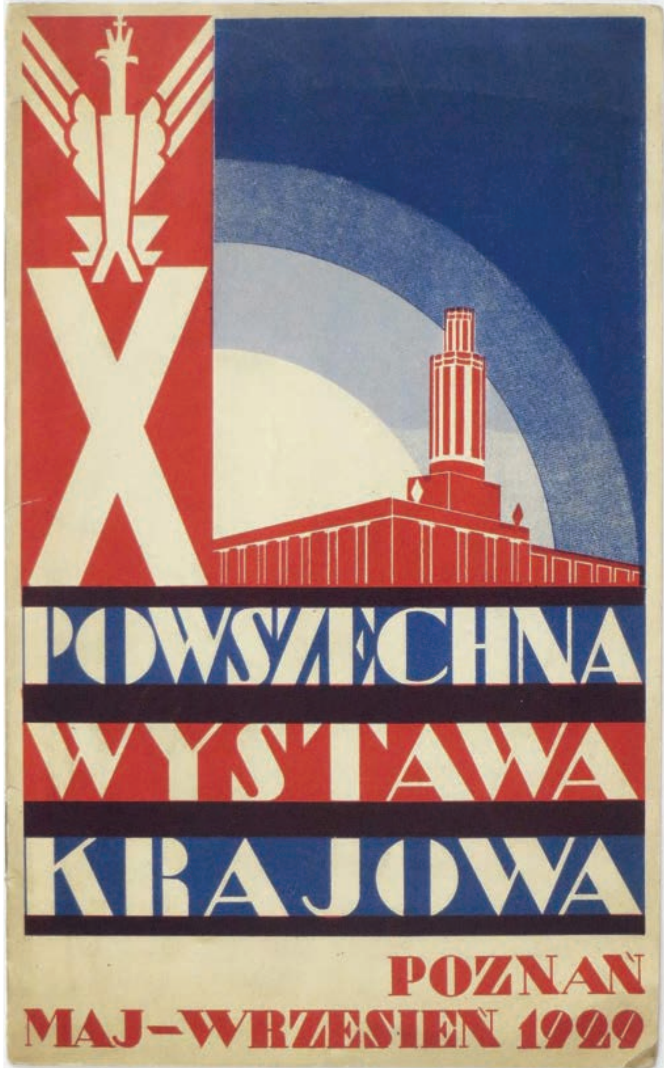
aut. Wojciech Jastrzębowski, ze zbiorów Muzeum Józefa Piłsudskiego w Sulejówku